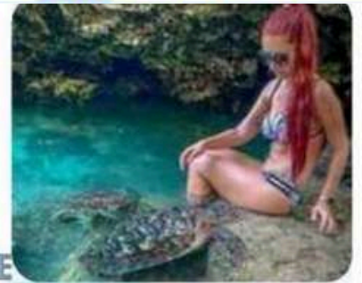
The Beach Paradise