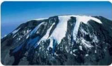
ERSTEIGEN SIE DEN KILIMANDSCHARO