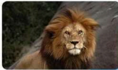
TANSANIA SAFARI TOUR